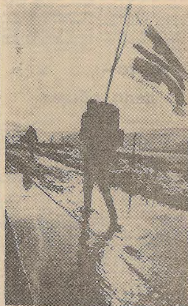
«Марш мира-86». Выставка «Интерпрессфото-87». Премия Комитета мира.